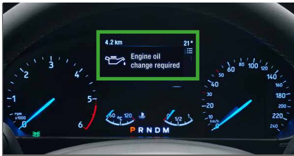
A kép egy Ford Fiesta műszerfalat ábrázol. A kép járműtípustól függően eltérhet.